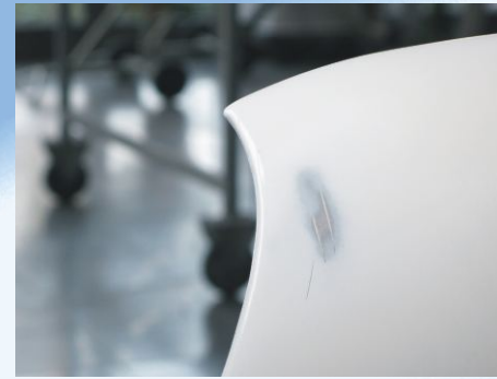
fertig geschliffene Schadstelle