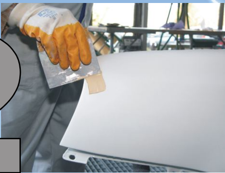
Spachtel in dünnen Arbeitsgängen auftragen