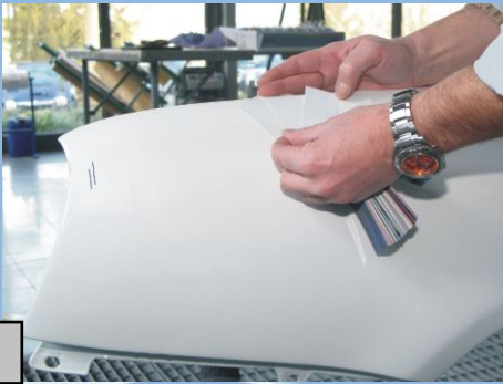
frühzeitig den richtigen Farbton ermitteln