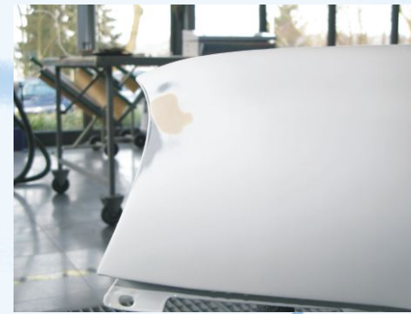
fertig geschliffene Spachtelstelle