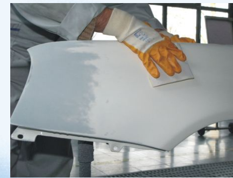
Reparaturstelle reinigen und entfetten

Es gelten die Verarbeitungshinweise gemäß unseren aktuellen technischen Merkblättern.