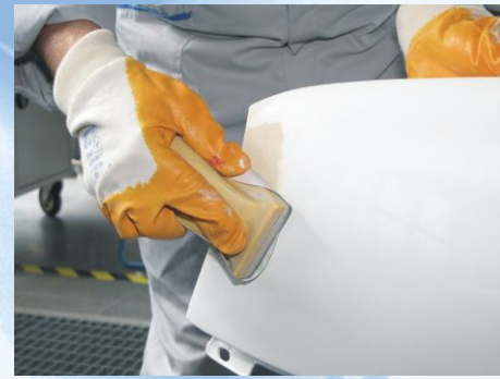
Spachtel nach dem Aushärten planschleifen