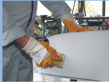
Beschädigung möglichst klein und fein anschleifen