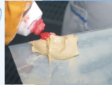
Spachtelmasse anmischen - nicht zuviel Härter einsetzen