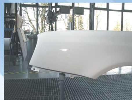
Decklack gem. Vorgabe und Umgebungstemperatur trocknen