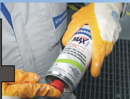
Spraydose aufschütteln (bei 2K-Produkten zuvor Härterzugabe auslösen)